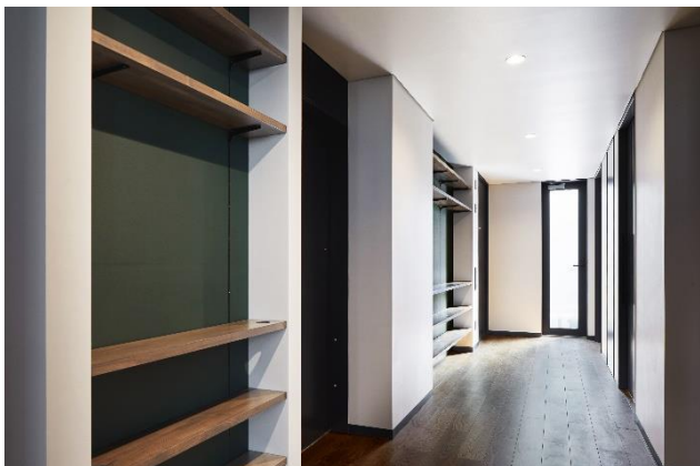
基準階パントリー