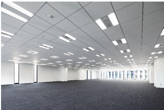
基準階オフィススペース