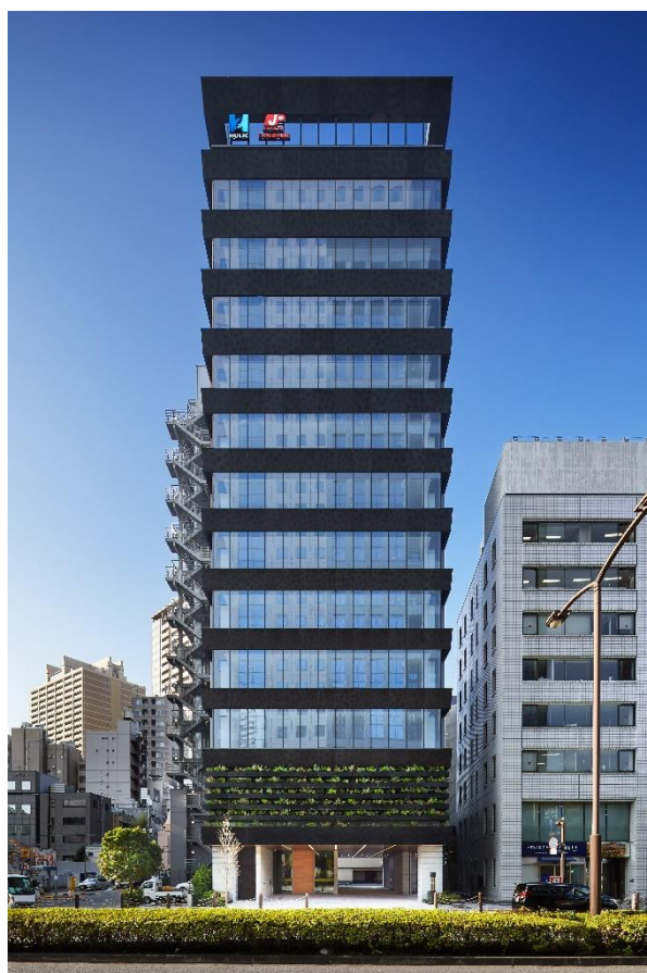
外堀通り側ファサード