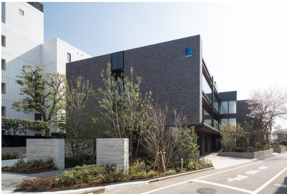
【チャームプレミア田園調布】

当建物は、東急東横線「田園調布」駅から徒歩約5分、閑静な住宅地に位置しており、歴史ある高台の邸宅地・田園調布らしさの継承と、豊かな緑を育む周辺環境との調和をコンセプトに空間づくりを目指しました。当建物は、約18㎡の個室を主とする計40戸の老人ホームとして運営会社の(株)チャーム・ケア・コーポレーションに一括賃貸致します。