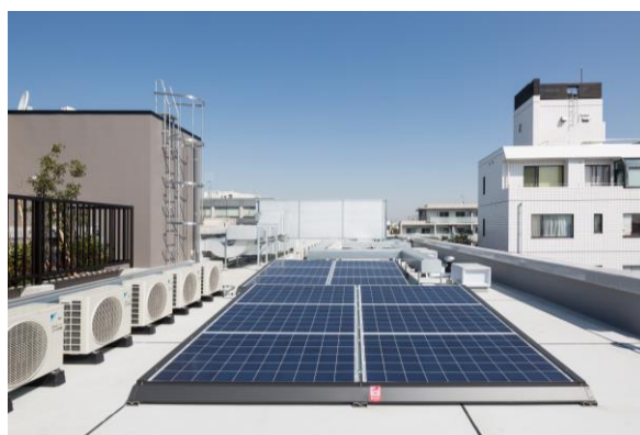
【屋上太陽光パネル】