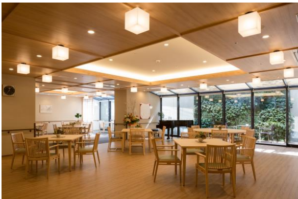
【食堂兼機能訓練室】