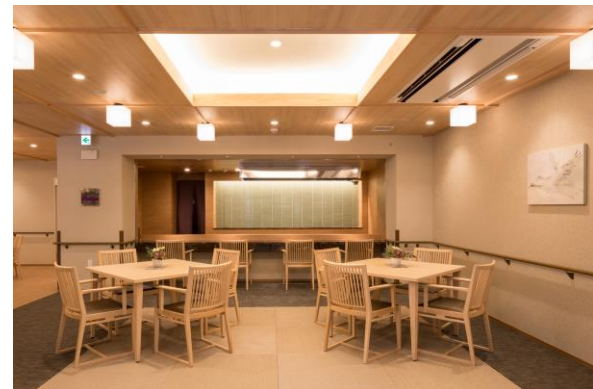
【オープンキッチン】

外部空間については既存樹の桜やヒマラヤスギを残し、地域の豊かな緑との調和を図りました。桜は各階ラウンジの正面と西側道路中央に位置し、春には入居者の方・近隣の方、双方に楽しんでいただけます。