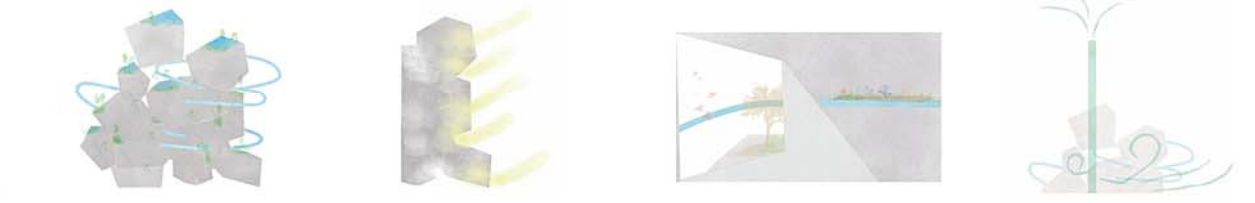
チューブは蓄えた雨水を建物全体に通します。雨水は植物に与えたり、滝を作り出したりします。 多角形のポリウムが積み重なることで、光が反射して自然の中のような空間ができます。 チューブで建物内外に水を通し、建物全体を緑化します。植物は空気をきれいにしたたり、湿度も調整します。また、ミストは周辺を涼しくします。 山下公園に吹いている海風を建築内に取り入れ煙突効果によって外へと放出します。